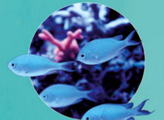
デバスズメダイ Chromis viridis