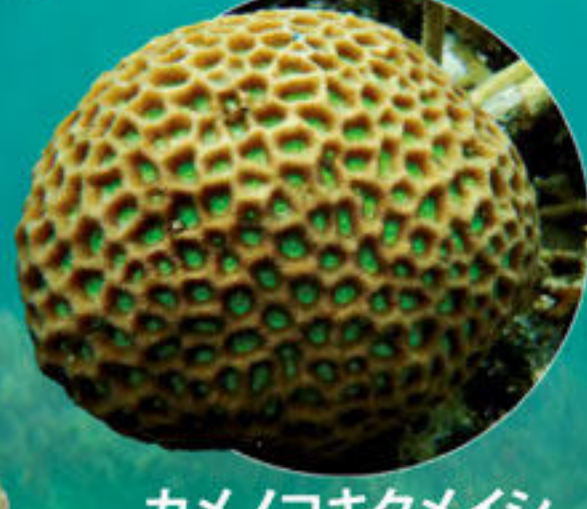
カメノコキクメイシ Favites abdita