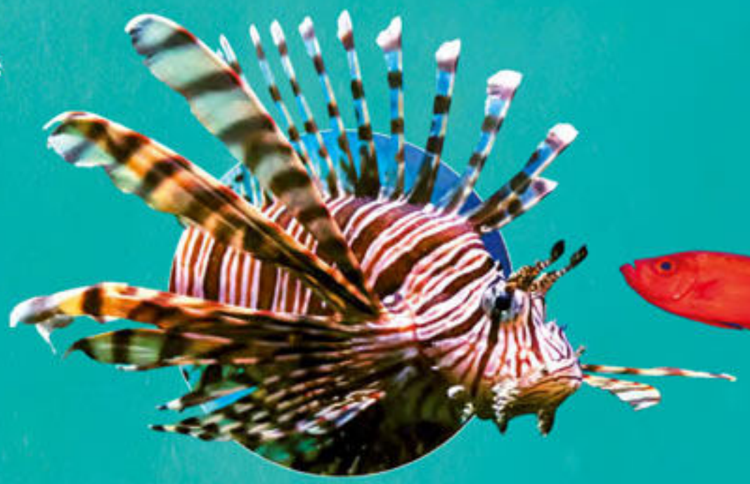
ハナミノカサゴ Pterois voltans