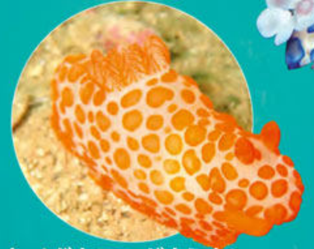
キイボキヌハダウミウシ Gymnodoris impudica