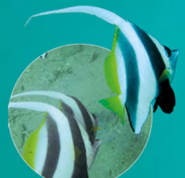
ハタタテダイ Heniochus acuminatus