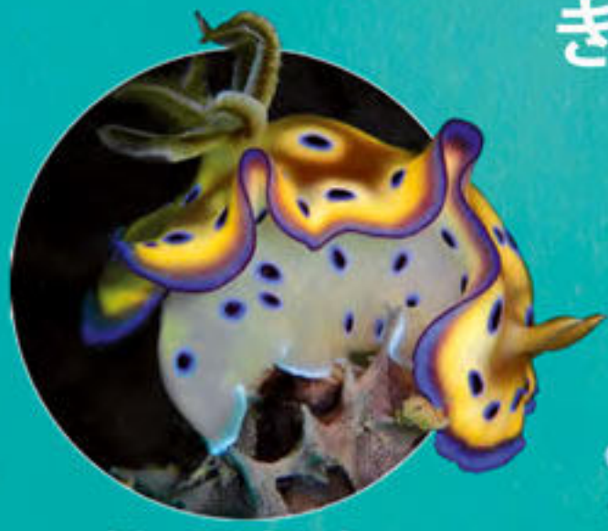
オトヒメウミウシ Goniobranchus kuniei