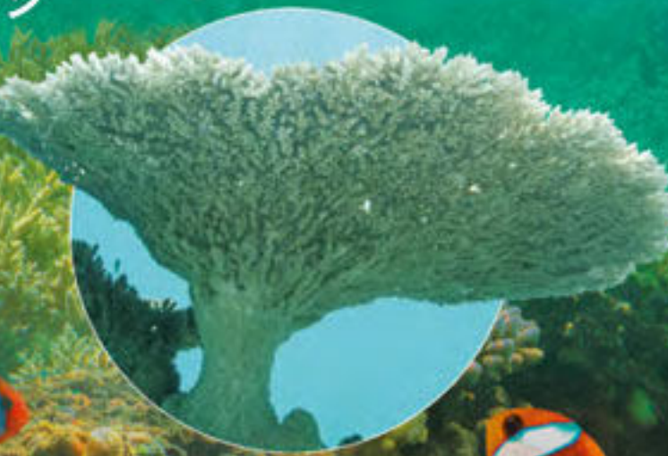
ミドリイシ Acropora sp.