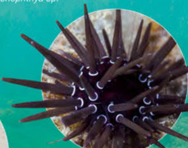
ナガウニモドキ Parasalenia gratiosa