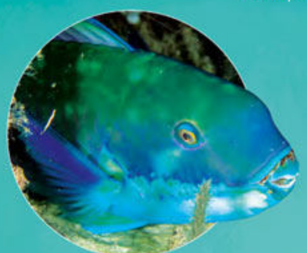
ナンヨウブダイ Chlorurus microrhinos