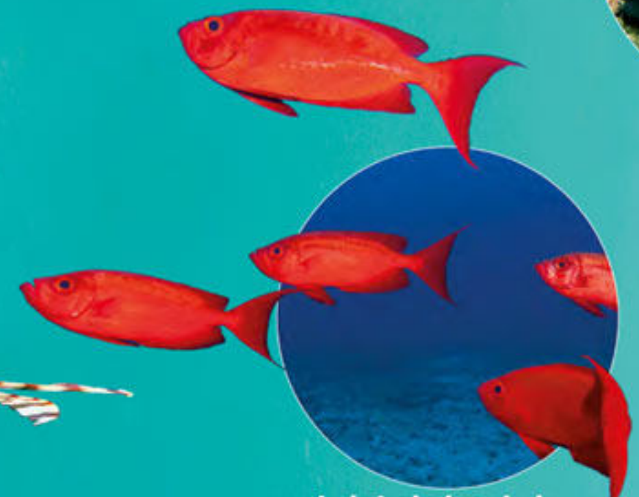
ホウセキキントキ Priacanthus hamrur