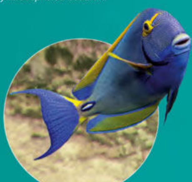
ニセカンランハギ Acanthurus dussumieri