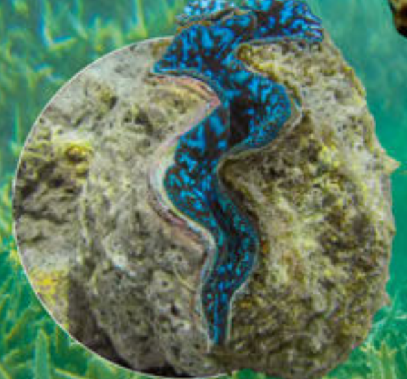
シラナミガイ Tridacna maxima