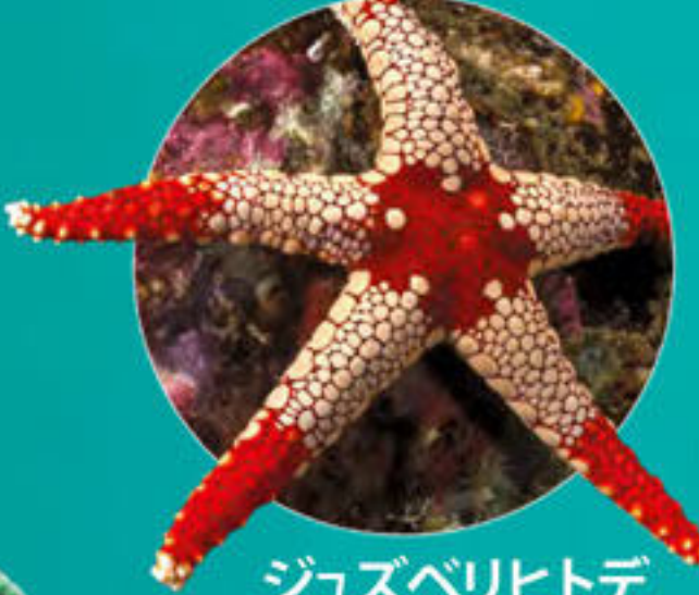
ジュズベリヒトデ Fromia monilis