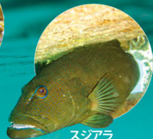
スジアラ Plectropomus leopardus