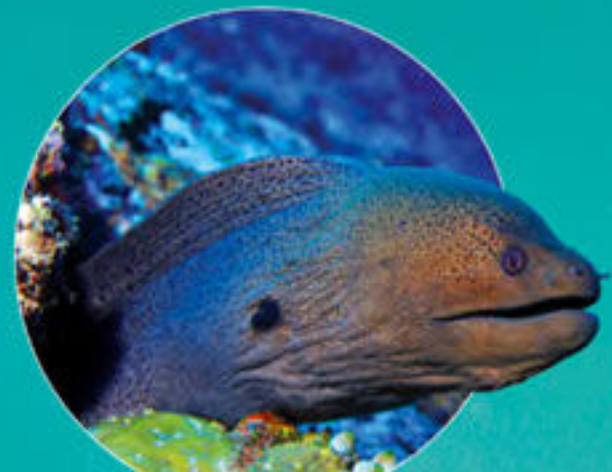
ドクツツボ Gymnothorax javanicus