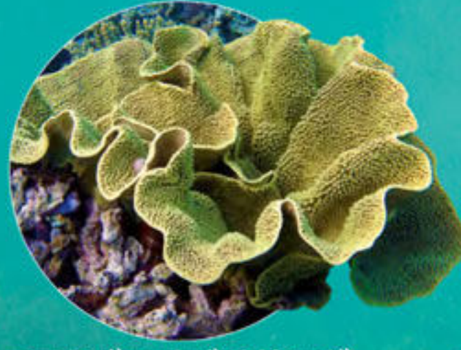
ヨコモズスリバチサンゴ Turbinaria reniformis