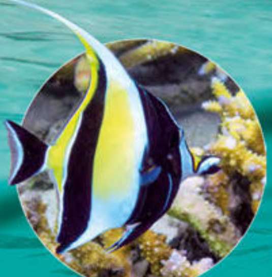
ツノダシ Zanclus cornutus