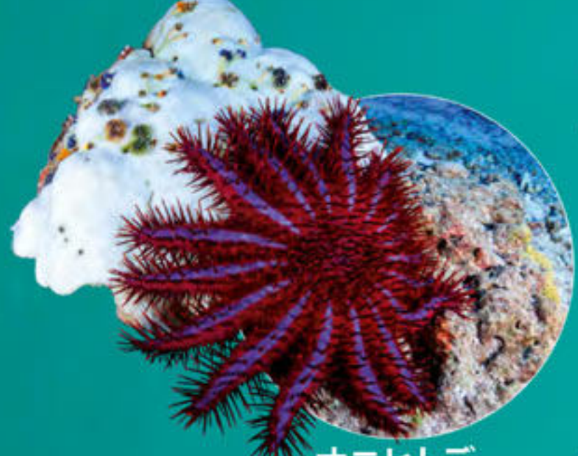
オニヒトデ Acanthaster planci