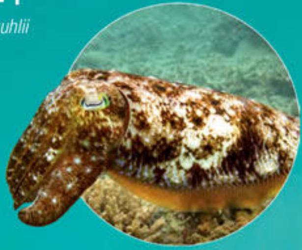
イカ Sepia latimanus