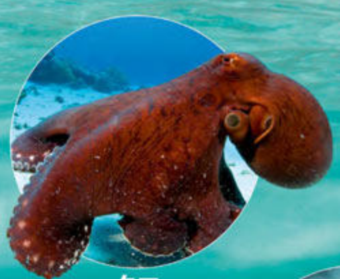
タコ Octopus sp.