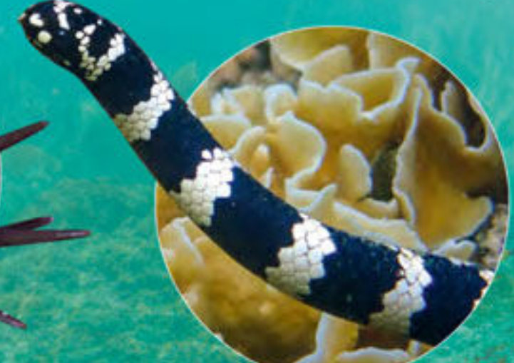
カメガシラウミヘビ Emydocephalus annulatus