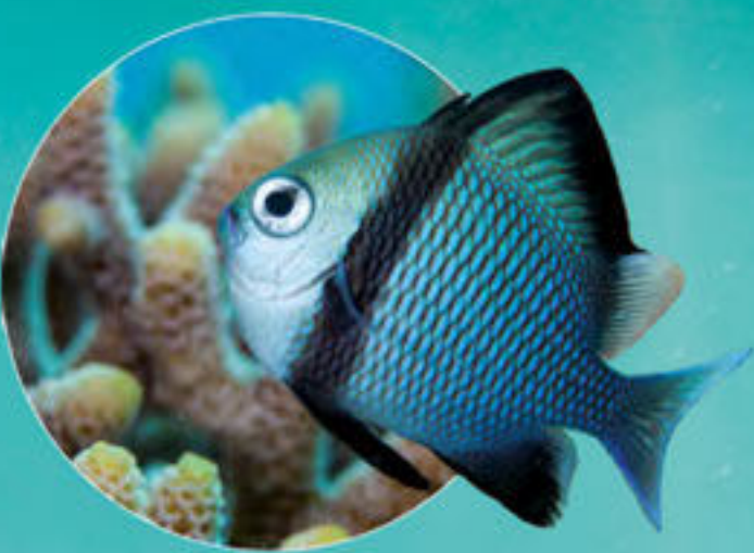
フタスジリュウキュウスズメダイ Dascyllus reticulatus