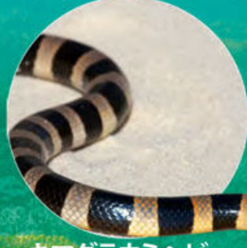
キマダラウミヘビ Laticauda saintgironsi