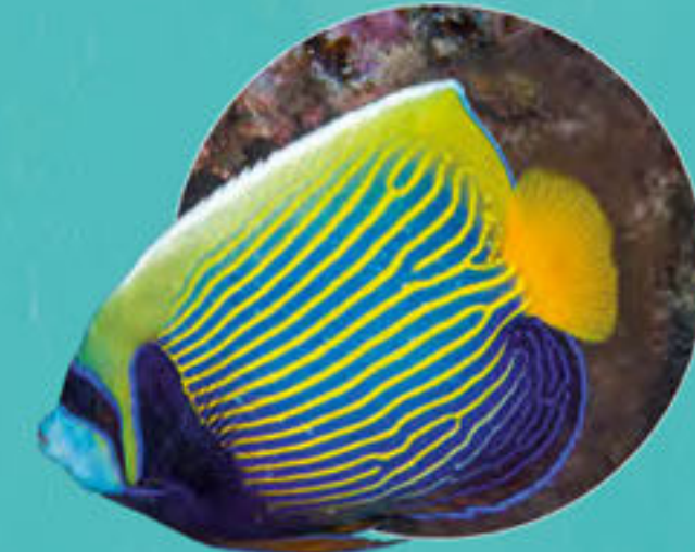
タテジマキンチャクダイ Pomacanthus imperator