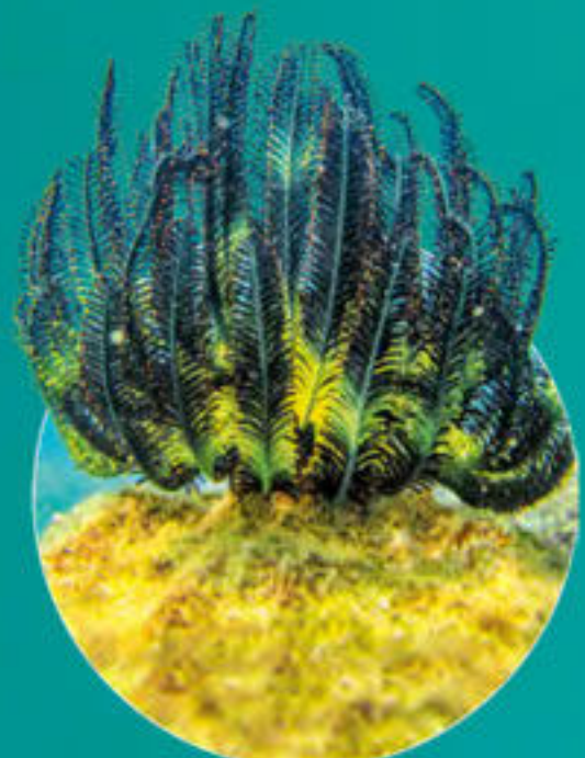
コアシウミシダ Comanthus parvicirrus