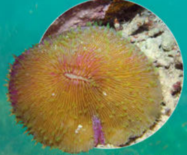
シタザラクサビライシ Fungia fungites