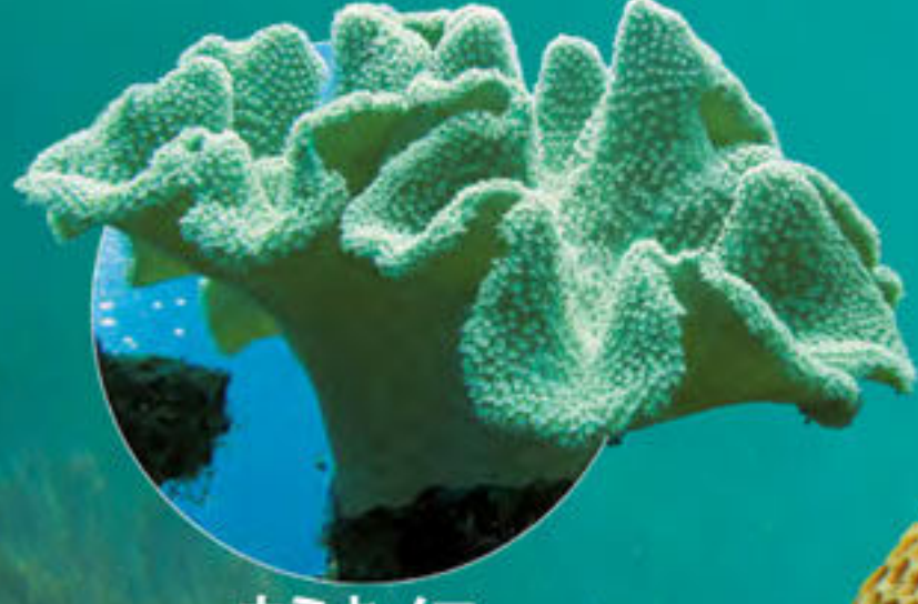
ウミキノコ Sarcophyton sp.