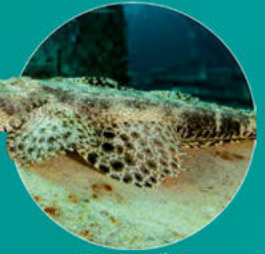
エンマゴチ Cymbacephalus beauforti