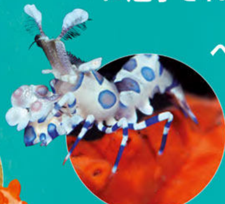
フリソデエビ Hymenocera picta