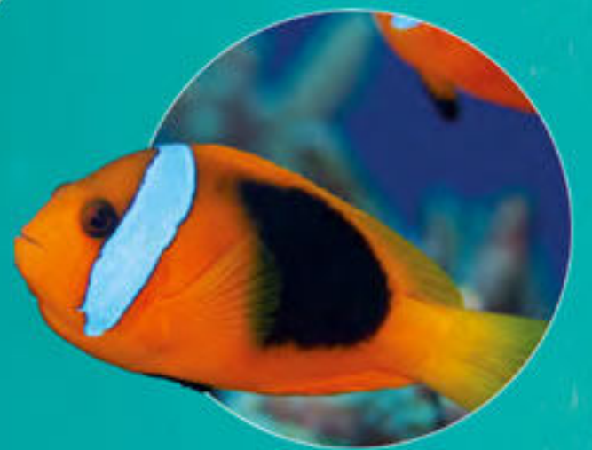
レッドアンドブラックアネモネフィッシュ Amphiprion melanopus