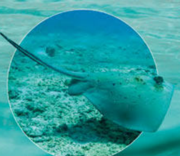
ヤッコエイ Neotrygon kuhlii