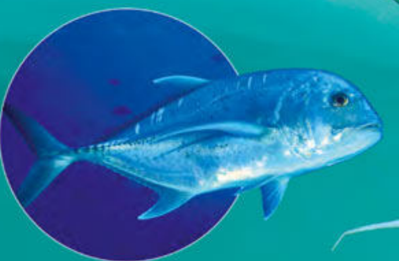
ロウニンアジ Caranx ignobilis