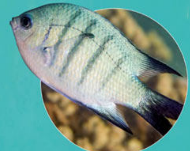
ホホワイトレイズサージャント Abudefduf whiteleyi