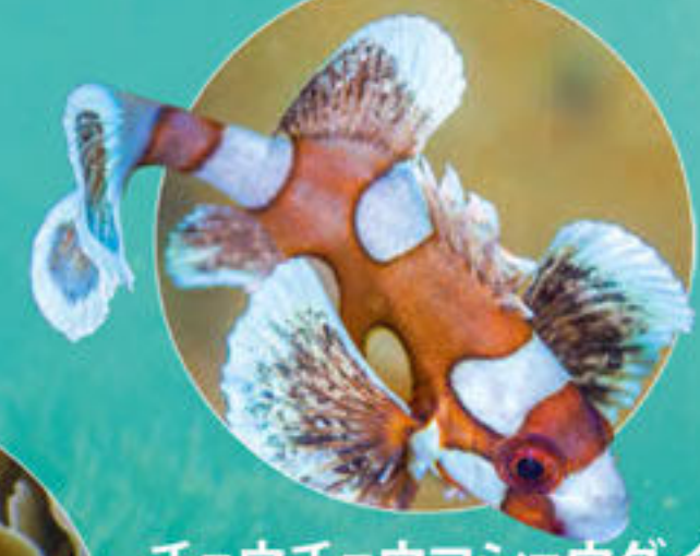
チョウチョウコショウダイ Plectrohinchus chaetodonoides