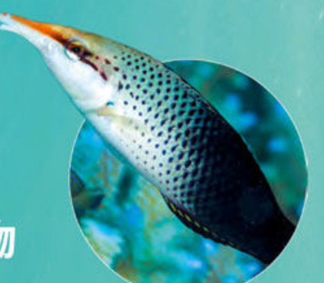
クギベラ Gomphosus varius