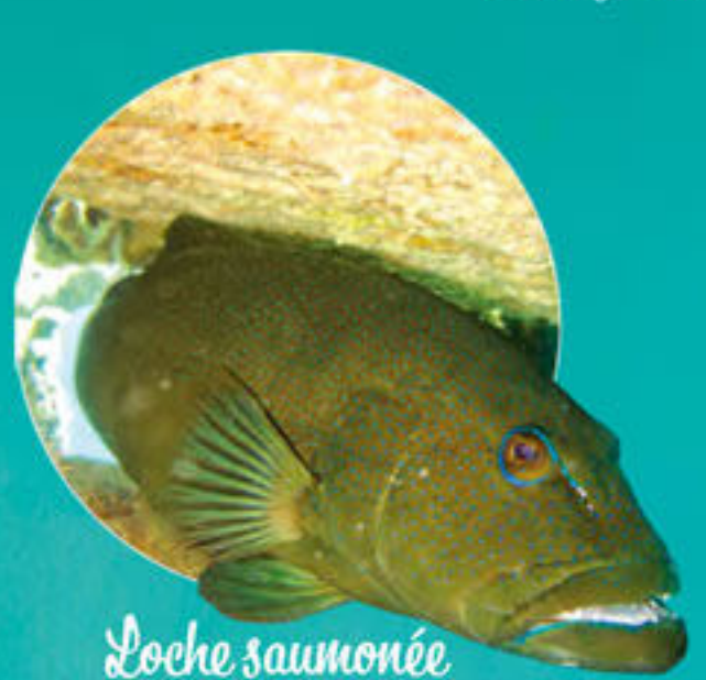
Loche saumonée Plectropomus leopardus