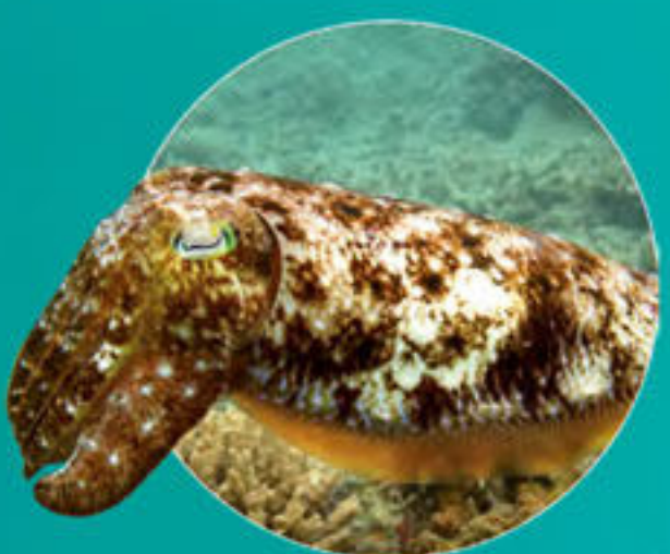
Seiche Sepia latimanus