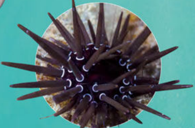
Oursin à anneaux blancs Parasalenia gratiosa