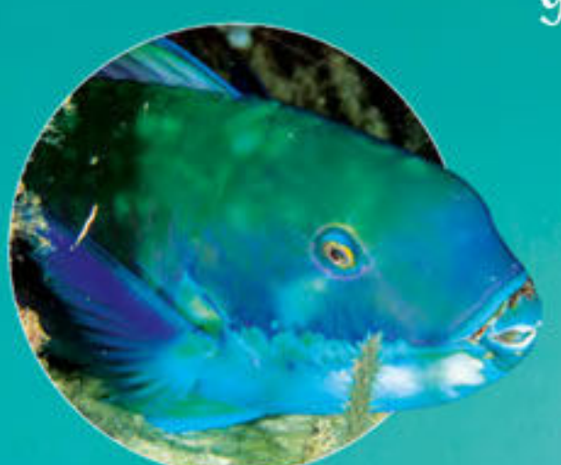
Poisson perroquet bleu Chlorurus microrhinos