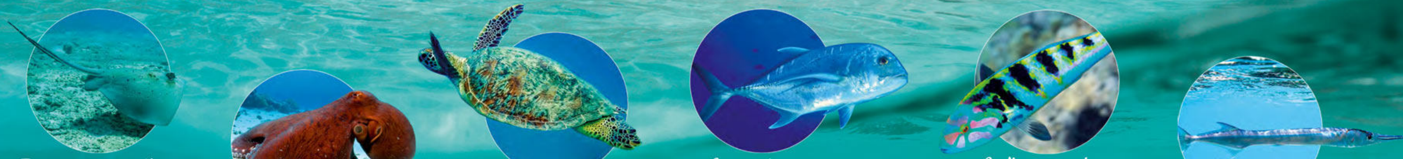
Raie à points noirs et bleus Neotrygon kuhlii