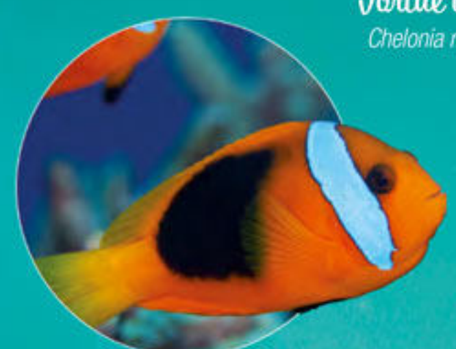
Poisson clown Amphiprion melanopus