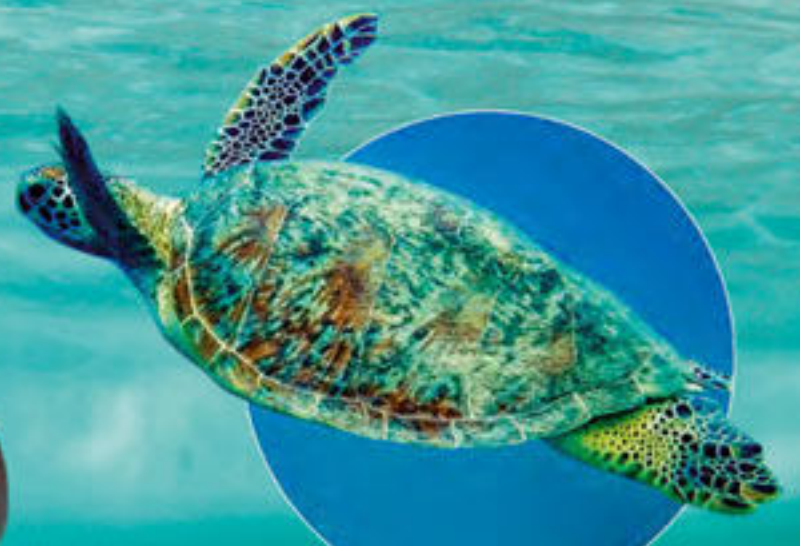
Tortue verte Chelonia mydas