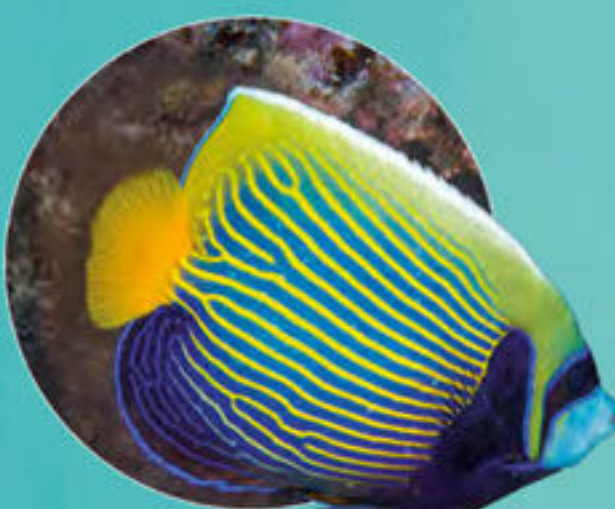
Poisson-ange empereur Pomacanthus imperator