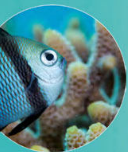
Poisson demoiselle reticulée Dascyllus reticulatus