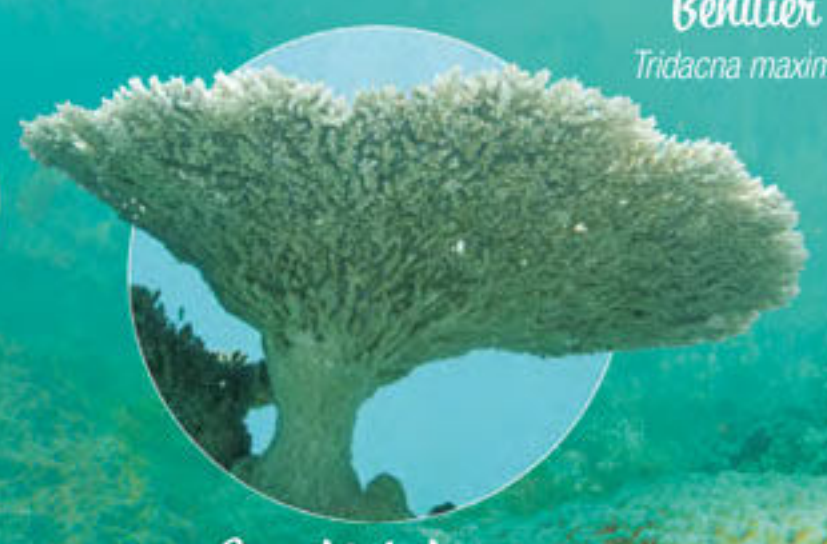
Corail tabulaire Acropora sp.