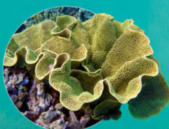
Corail foliacé Turbinaria reniformis