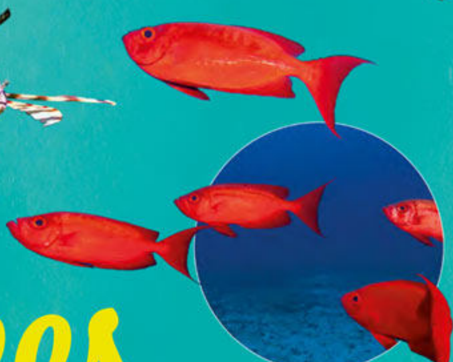
Gros-yeux commun Priacanthus hamur