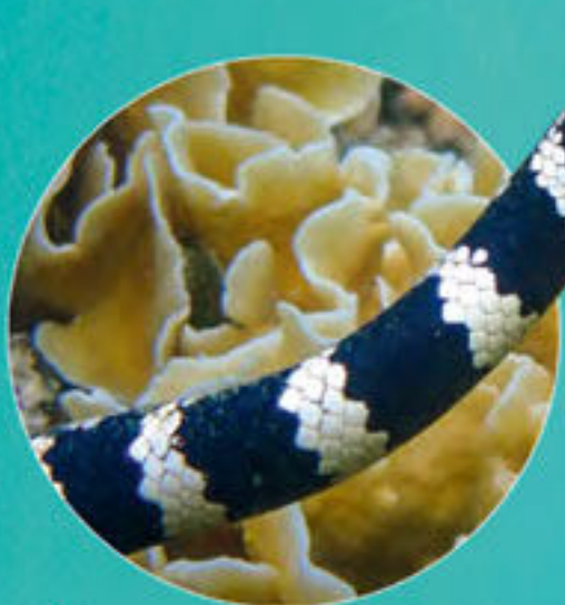
Serpent à tête de tortue Emydocephalus annulatus