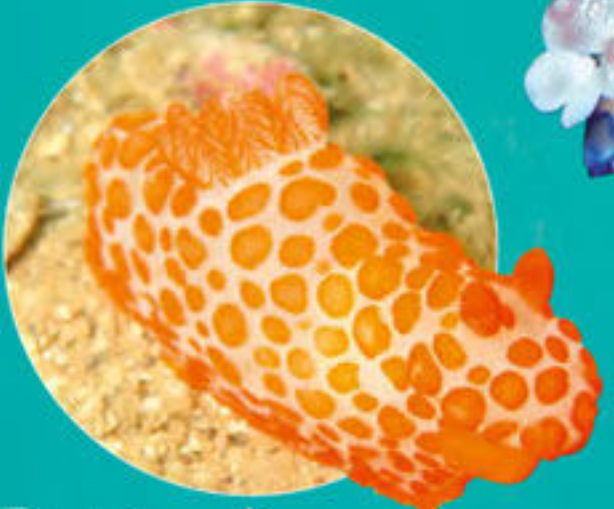
Doris à papilles orangées Gymnodoris impudica