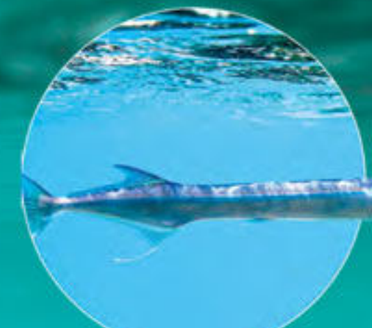
Aiguillette Tylosurus crocodilus crocodilus