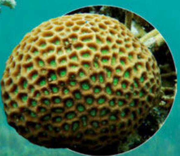
Corail massif à bouche verte Favites abdita