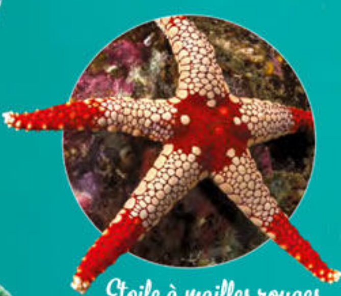
Etoile à mailles rouges Fromia monilis