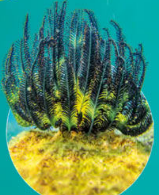
Comatule Comanthus parvicirrus