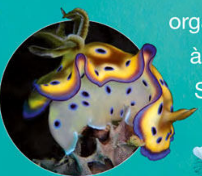
Doris de Kunié Goniobranchus kumiei