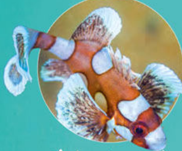
Loche castex juvenile Plectrothorichus chaetodonoides