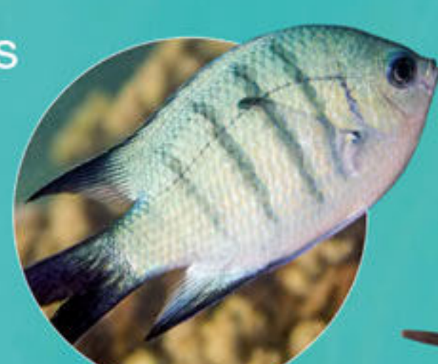
Sergent-major à queue noire Abudefduf whiteleyi