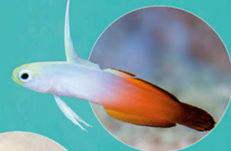
Poisson-fêchette Nemateletris magnifica