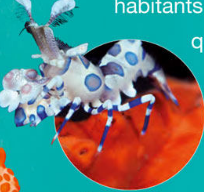
Crevette arlequin Hymenocera picta