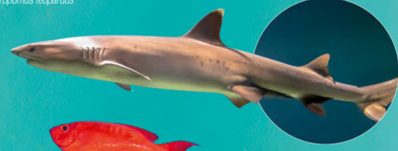
Requin corail Triaenodon obesus