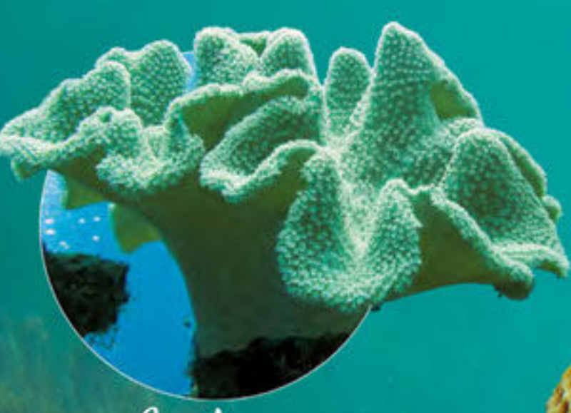
Corail mou Sarcophyton sp.