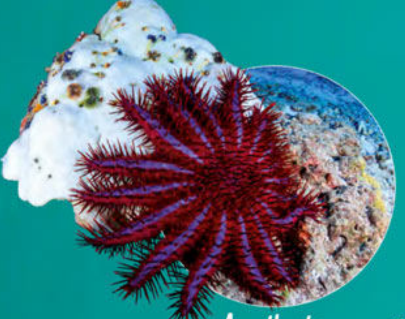
Acanthaster Acanthaster planci