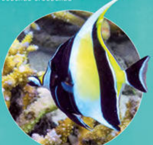
Idole Maure Zanclus cornutus