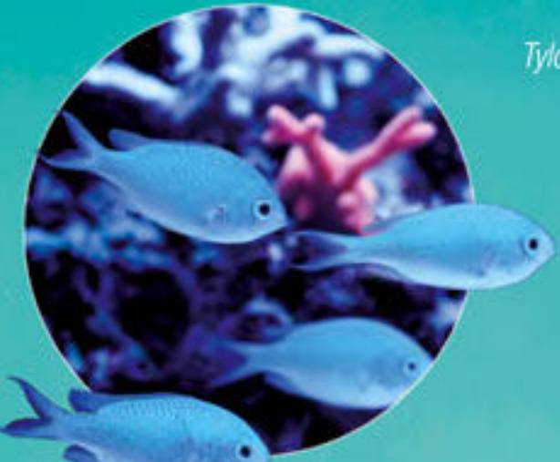
Demoiselle bleu-vert Chromis viridis