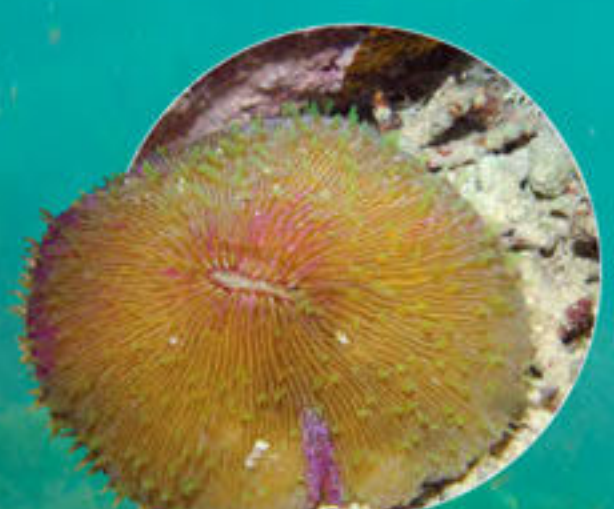
Corail tube Fungia fungites