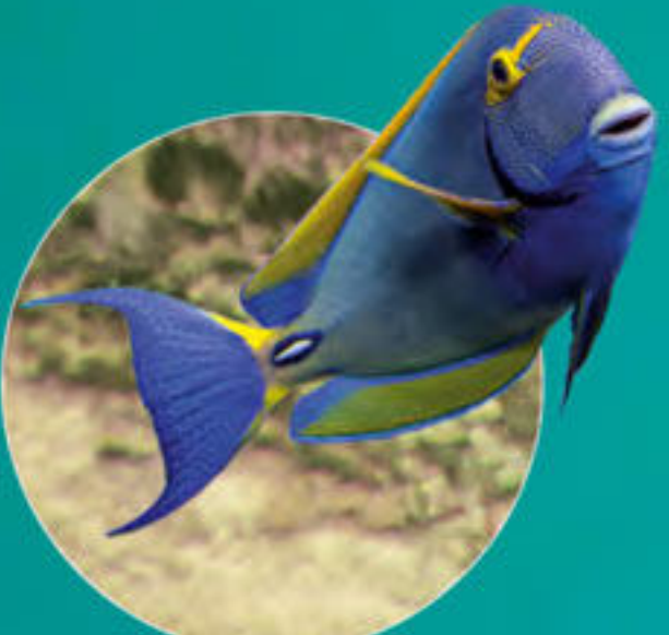
Poisson chirurgien Acanthurus dussumieri