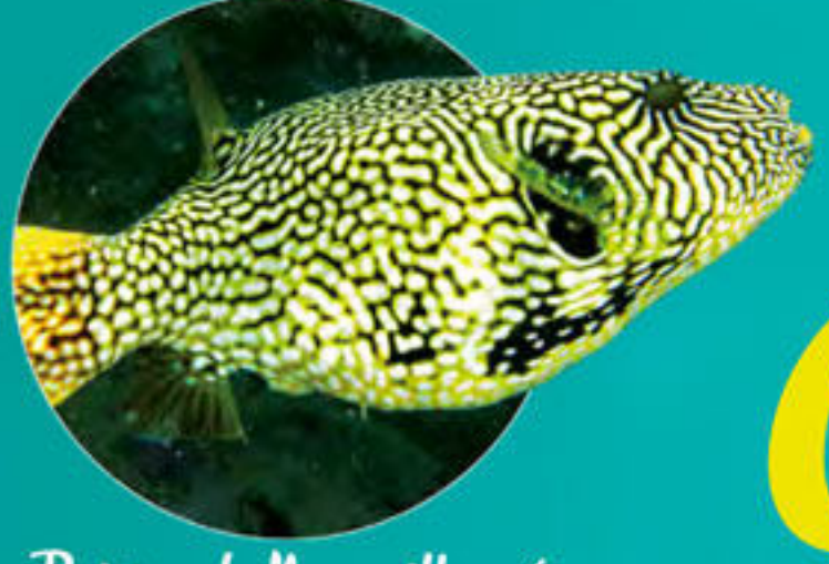
Poisson-ballon griffonné Arothron mappa