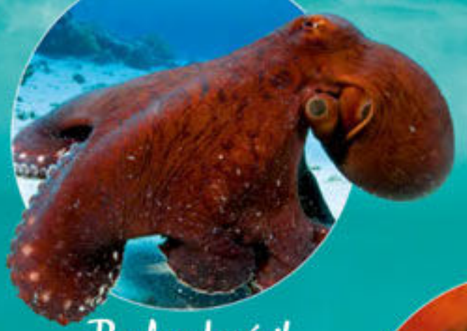
Poulpe de récif Octopus sp.