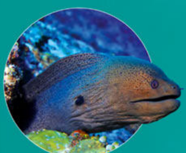
Murène javanaise Gymnothorax javanicus