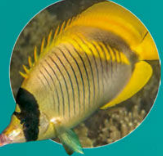
Poisson-papillon strié Chaetodon lineolatus