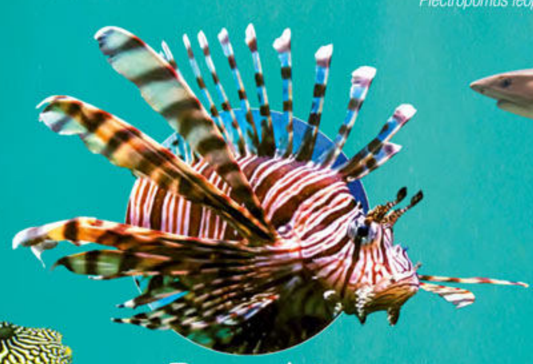
Raseasse volante Pterois voltans