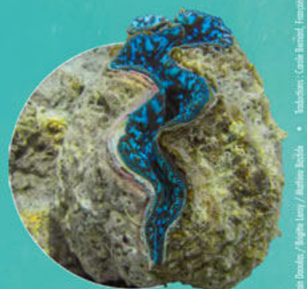
Bénitier Tridacna maxima