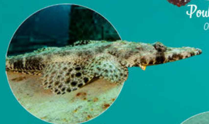
Poisson crocodile Cymbaccephalus beauforti